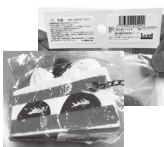
商品の一例(左)とOPP袋に貼付たシール例

その後、わーくるから近隣事業所へ受注の相談したところ、やってみたいとのこと。紹介、作業を開始することとなった。