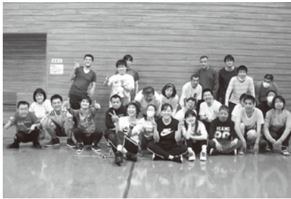
参加者全員で集合写真

横浜あゆみ荘では、障害のある方の余暇を応援する企画事業を実施してありますが、今回多くの方からご要望のあったダンス教室を三月二十一日（木・春分の日）に開催しました。初めての開催にも関わらず、市内在住の障害のある方二十四名と支援者合わせ総勢四十名の参加がありました。