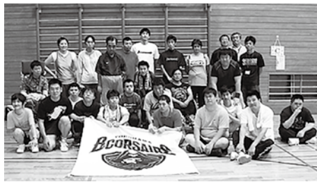
選手と参加者全員で記念撮影

六月二十四日(土)、プロバスケットボールBリーグ『横浜ビー・コルセアーズ』の選手とスタッフを講師に迎え、余暇活動支援事業『障害のある方のためのバスケットボール教室』を横浜あゆみ荘および都筑地区センターにて開催しました。